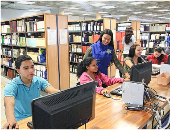
Begünstigte des Stipendienprogramms an der Uni, betreut von einer Presencia-Erzieherin.