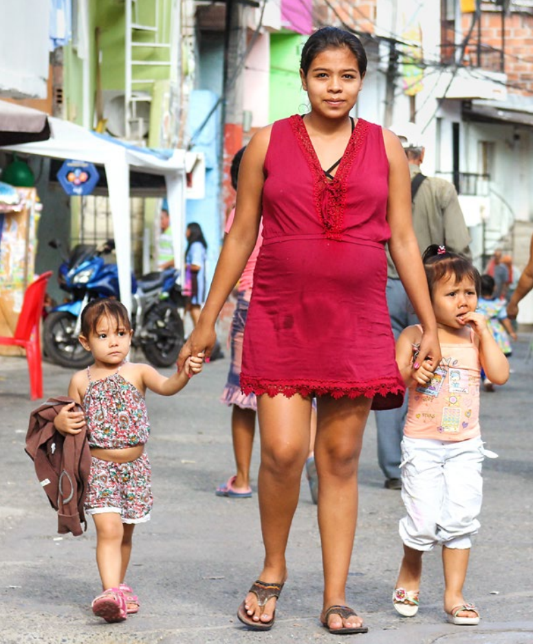
Teenager-Mutter mit ihren Kindern.

Die jüngsten Mütter sind in diesen Zahlen gar nicht erst enthalten: Werden unter 14-Jährige schwanger, gilt dies nicht als Teenager-Schwangerschaft, sondern als sexueller Missbrauch. Obwohl sexuelle Beziehungen mit unter 14-Jährigen gesetzlich unter Strafe stehen, klagen die betroffenen Familien selten.