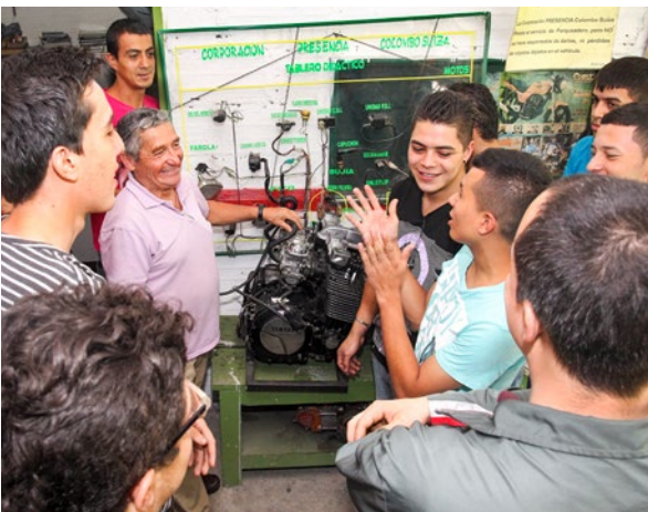
Motorradmechaniker in Ausbildung.

In Notsituationen leisten wir Spezialhilfe. Diese zusätzliche Unterstützung dient dazu, Kindern, Jugendlichen und ihren Familien rasch und unkompliziert zu helfen. Familien mit finanziellen Problemen erhalten zum Beispiel Warenkörbe mit den wichtigsten Grundnahrungsmitteln. 2016 haben wir rund 100 Kinder und Jugendliche sowie 20 Familien unterstützt. Die Familien haben wir über Monate hinweg mit Warenkörben versorgt. Zu den Spezialhilfen gehören im weiteren Vergütungen von Medikamenten, Brillen und Transportkosten oder ein Startkapital für die Gründung eines Unternehmens.